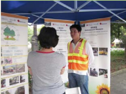
在大埔錦石新村舉行的吐露港公路擴闊工程巡迴展覽