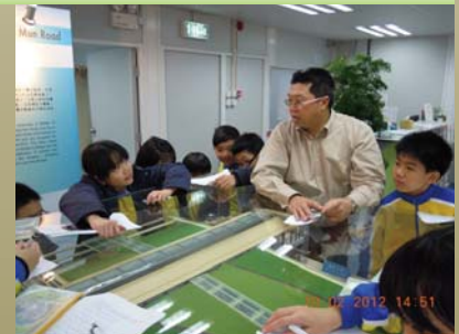
接待到訪工地的小學生