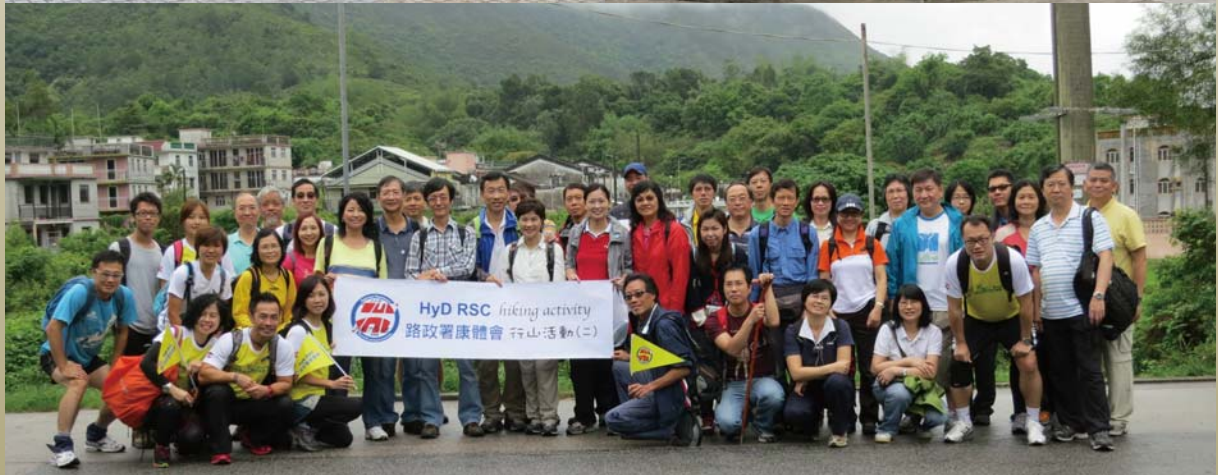
路政署康體會舉辦的環保活動