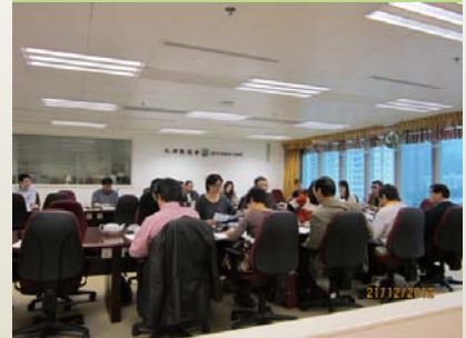
在區議會的綠化工作組匯報種植工作的進度