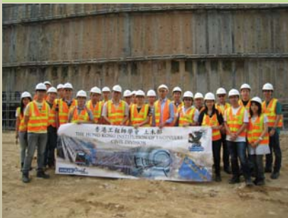
香港工程師學會參觀吐露港公路擴闊工程的工地