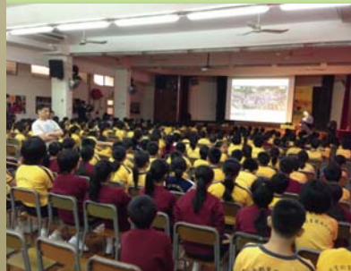
工程人員到訪學校，介紹工程背景及環保效益