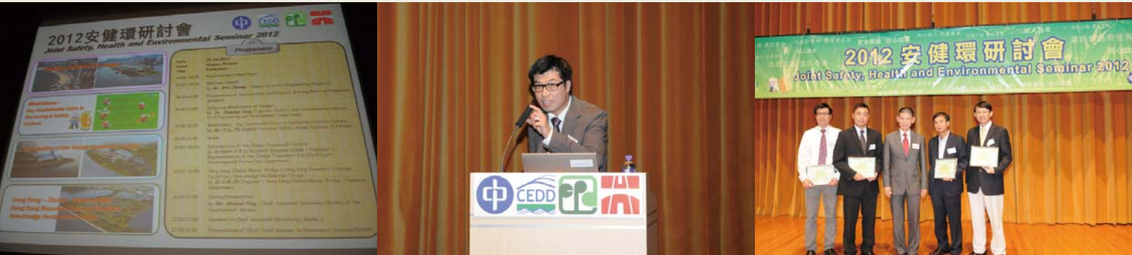
二零一二安健環研討會

為增進員工對環境管理措施方面的知識，我們繼續聯同中華電力有限公司、土木工程拓展署和環境保護署合辦二零一二安健環研討會。舉辦上述研討會，其一主旨在加深專業和技術人員對環境管理措施的認識。