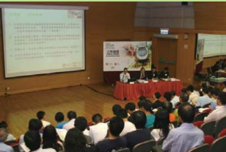
鐵路拓展處舉辦公眾參與活動的公眾論壇