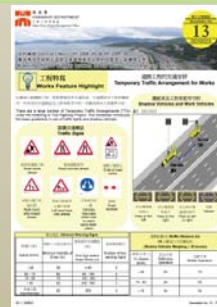
吐露港公路擴闊工程項目通訊