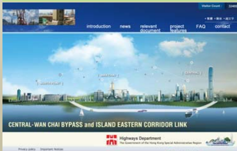
中環灣仔繞道項目網站