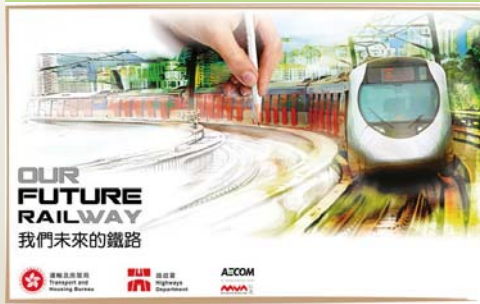
鐵路拓展處進行第一階段公眾參與活動，以檢討及修訂《鐵路發展策略2000》