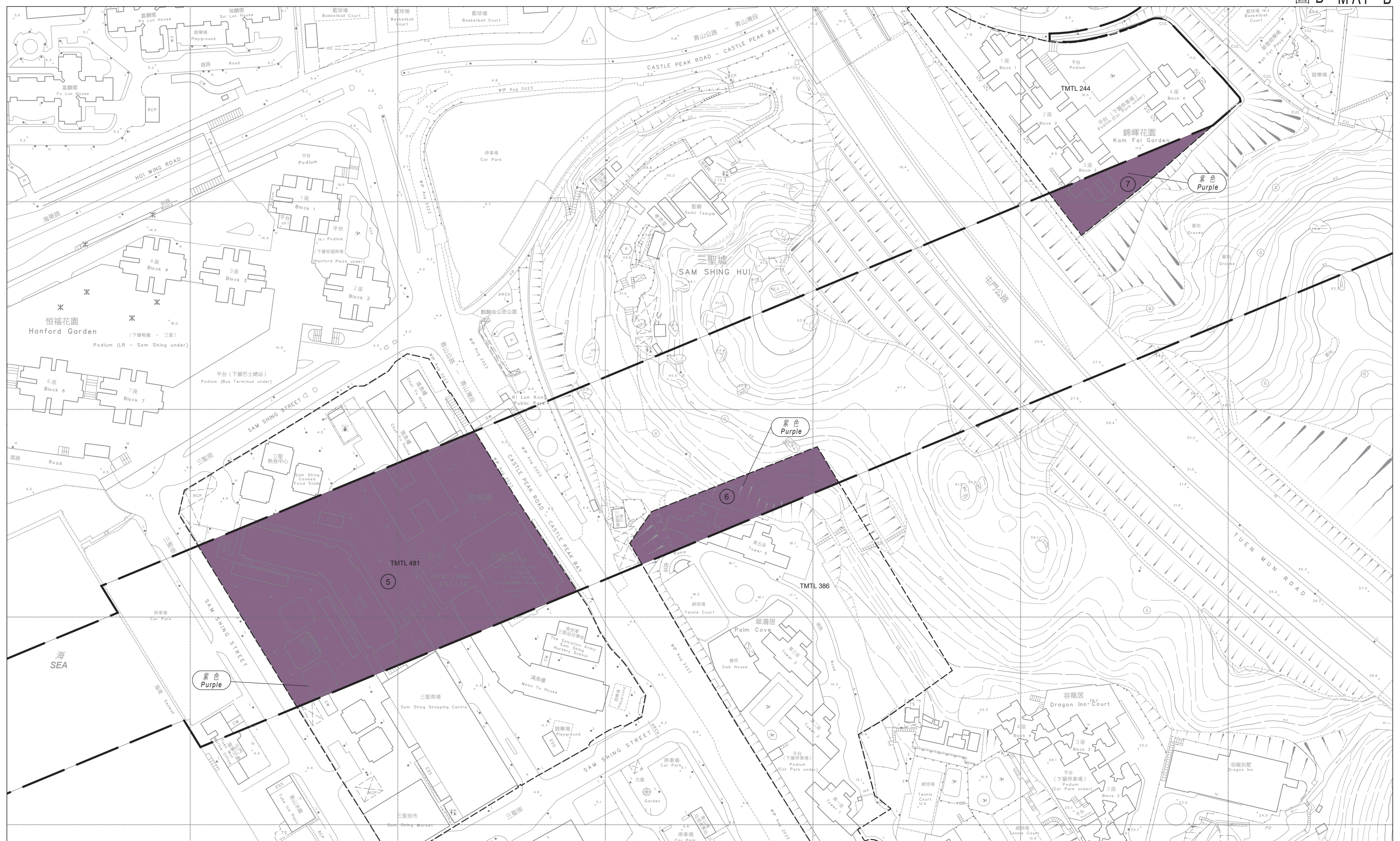
比例尺 SCALE 1:1 000 metres 20 0 20 40 60 80 100 metres