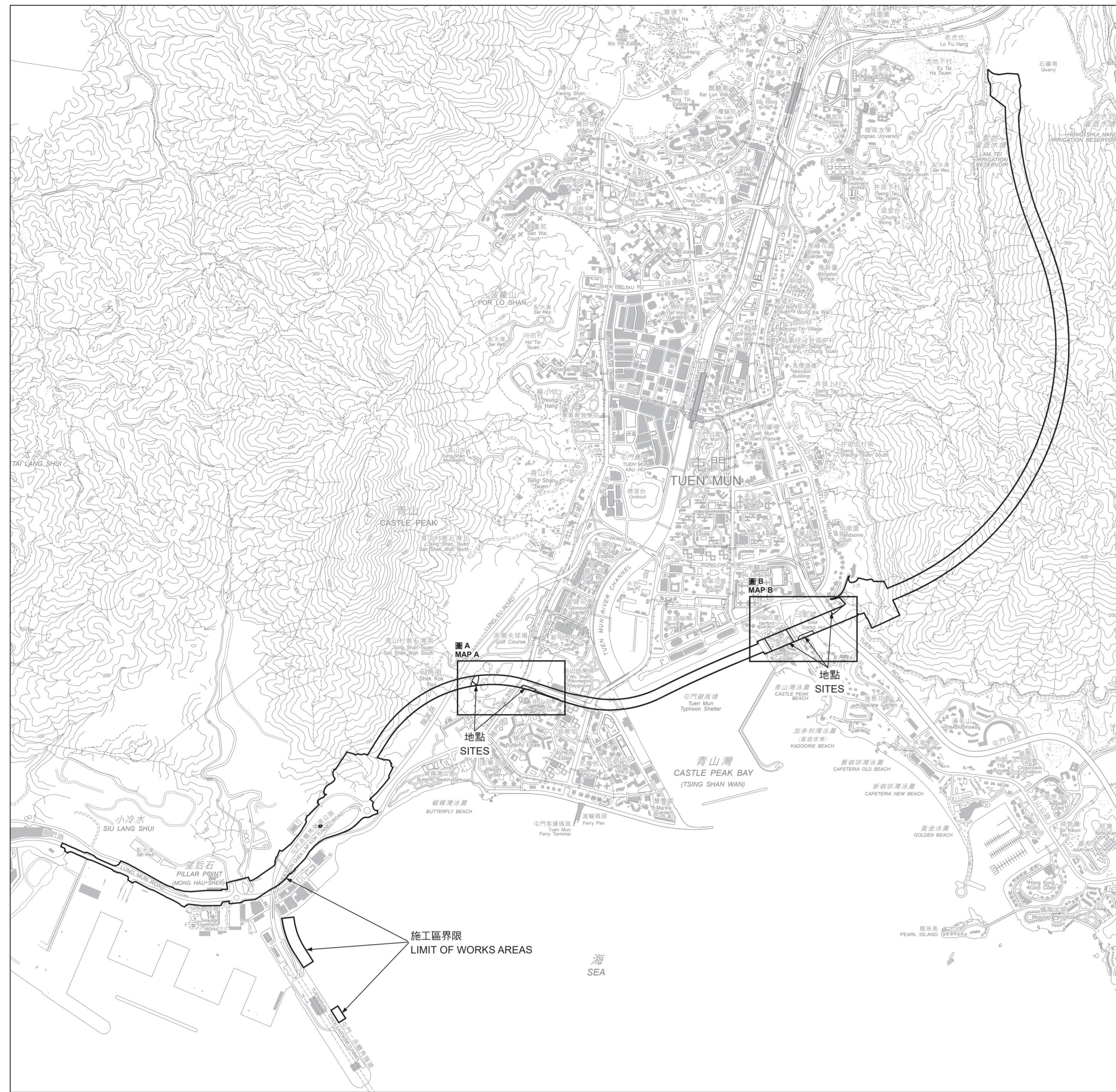
比例 SCALE 1:20 000