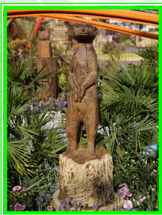
「台灣相思活化區」內升級轉型的台灣相思木雕塑