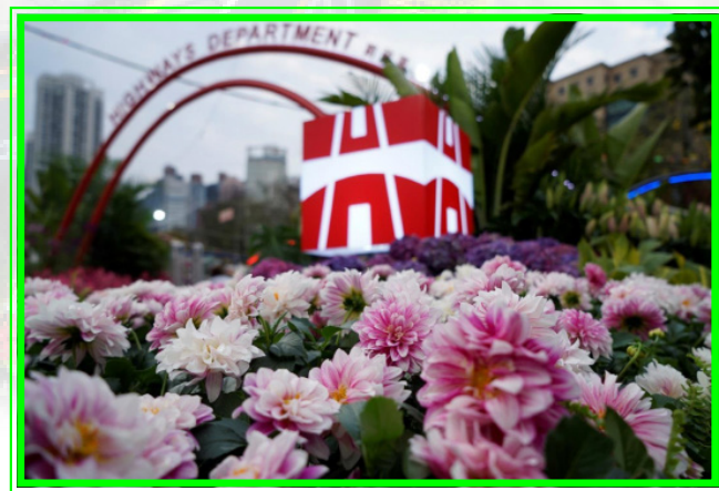
設計靈感來自花展主題花(大麗花)和大會主題「心花放」