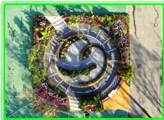
路政署展區鳥瞰圖

展區以「心·路歷程」為主題，中央位置以「心形」屏風向外延展，既配合花展主題「心花放」，又隱含不同階段道路網絡發展的意境，讓參觀者在遊走「心·路歷程」之際，憶起種種「快樂」回憶。展區另一特色是「台灣相思活化區」，介紹路政署的「前瞻性植被活化計劃」，其中不單展示了樹木生命週期，還呈現了台灣相思如何由木材「升級轉型」為生動有趣的雕塑和工藝品。