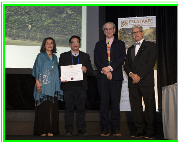
路政署代表在頒獎典禮上接受加拿大風景園林師協會代表頒授獎狀