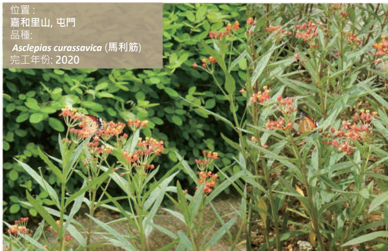
位置： 嘉和里山, 屯門 品種： Asclepias curassavica (馬利筋) 完工年份: 2020