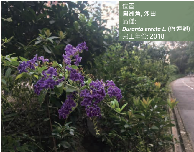
位置： 圓洲角, 沙田 品種： Duranta erecta L. (假連翹) 完工年份: 2018