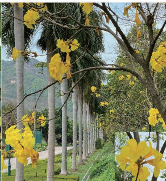
位置： 幻想道, 竹篙灣 品種： Tabebuia chrysostricha (黃花風鈴木) 完工年份: 2020