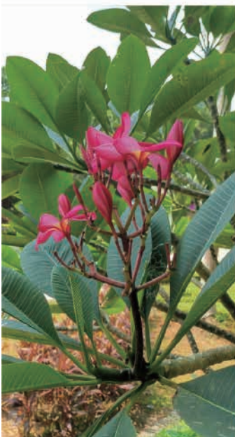
位置： 幻想道, 竹篙灣 品種： Plumeria rubra (紅雞蛋花) 完工年份: 2020