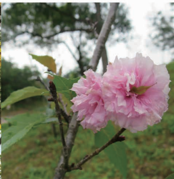
位置： 榮欣路, 竹篙灣 品種： Prunus lannesiana (重瓣櫻花) 完工年份: 2020