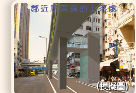
行人天橋將於廣東道/亞皆老街交界提供兩部升降機