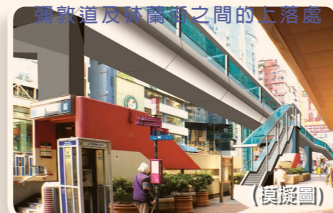
行人天橋將於彌敦道及砵蘭街之間的亞皆老街提供一道樓梯