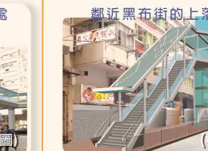
行人天橋將於黑布街提供一道樓梯及一部升降機