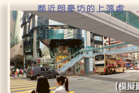
行人天橋將於朗豪坊外提供一道樓梯及一部升降機