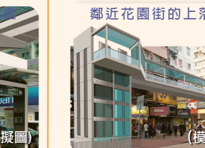
行人天橋將於花園街提供兩部升降機