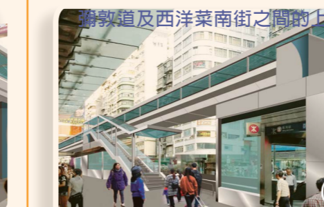
行人天橋將於彌敦道及西洋菜南街之間的亞皆老街提供一道樓梯