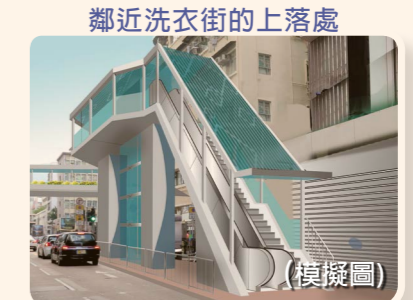
行人天橋將於洗衣街提供一道樓梯，一部升降機及一道電梯