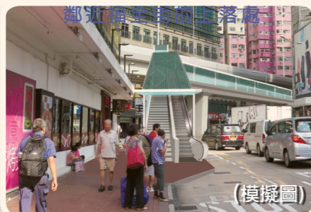
行人天橋將於福全街提供一道樓梯，一部升降機及一道電梯