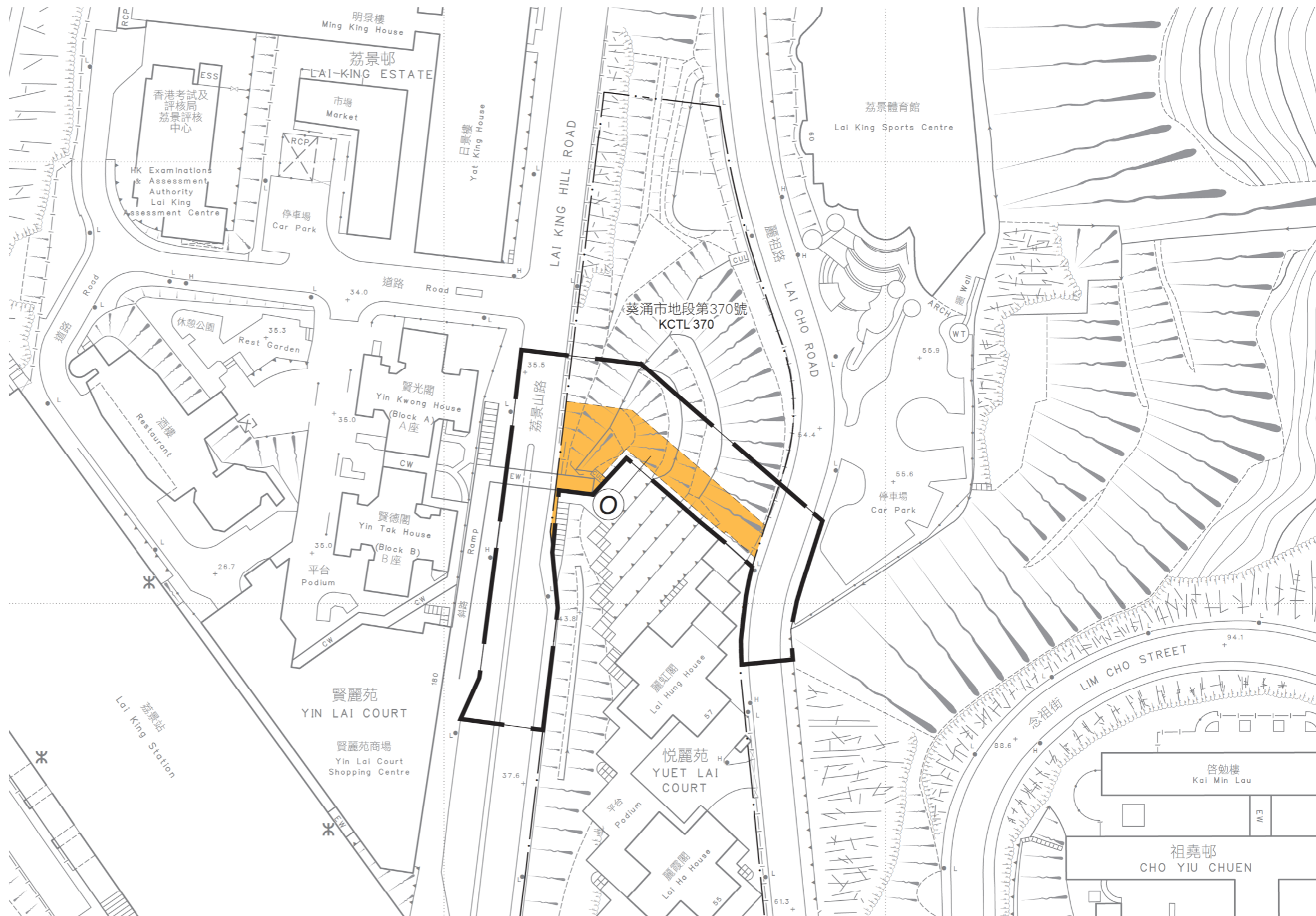
比例尺 SCALE 1:1 000